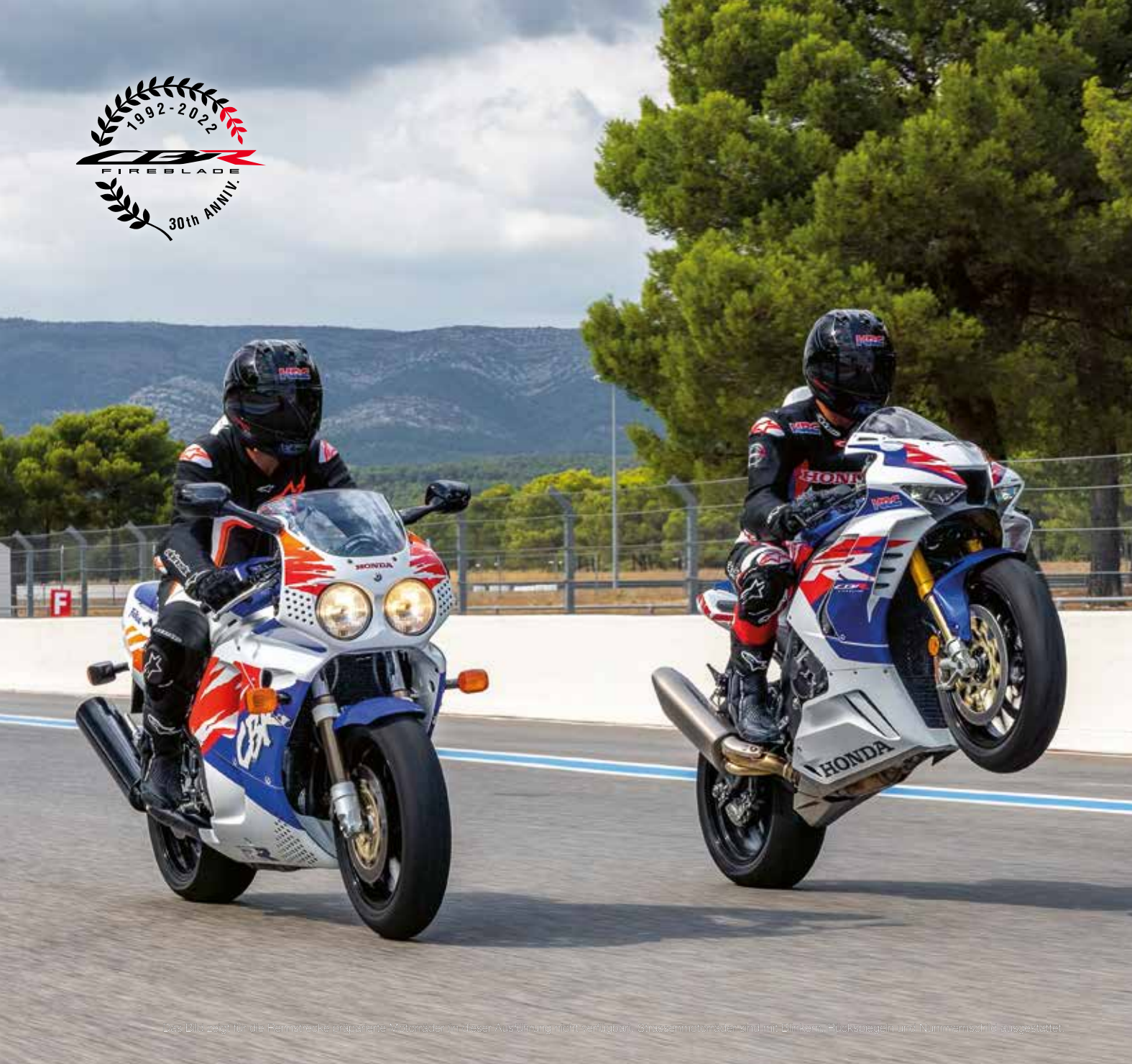
Das Bild zeigt für die Belmstrasse angeordnete Motorräder mit diesen Ausstattungen nicht verfügbar. Seriennummern sind nicht zu sehen. Die Abbildung zeigt die Seriennummer für die Motorräder.