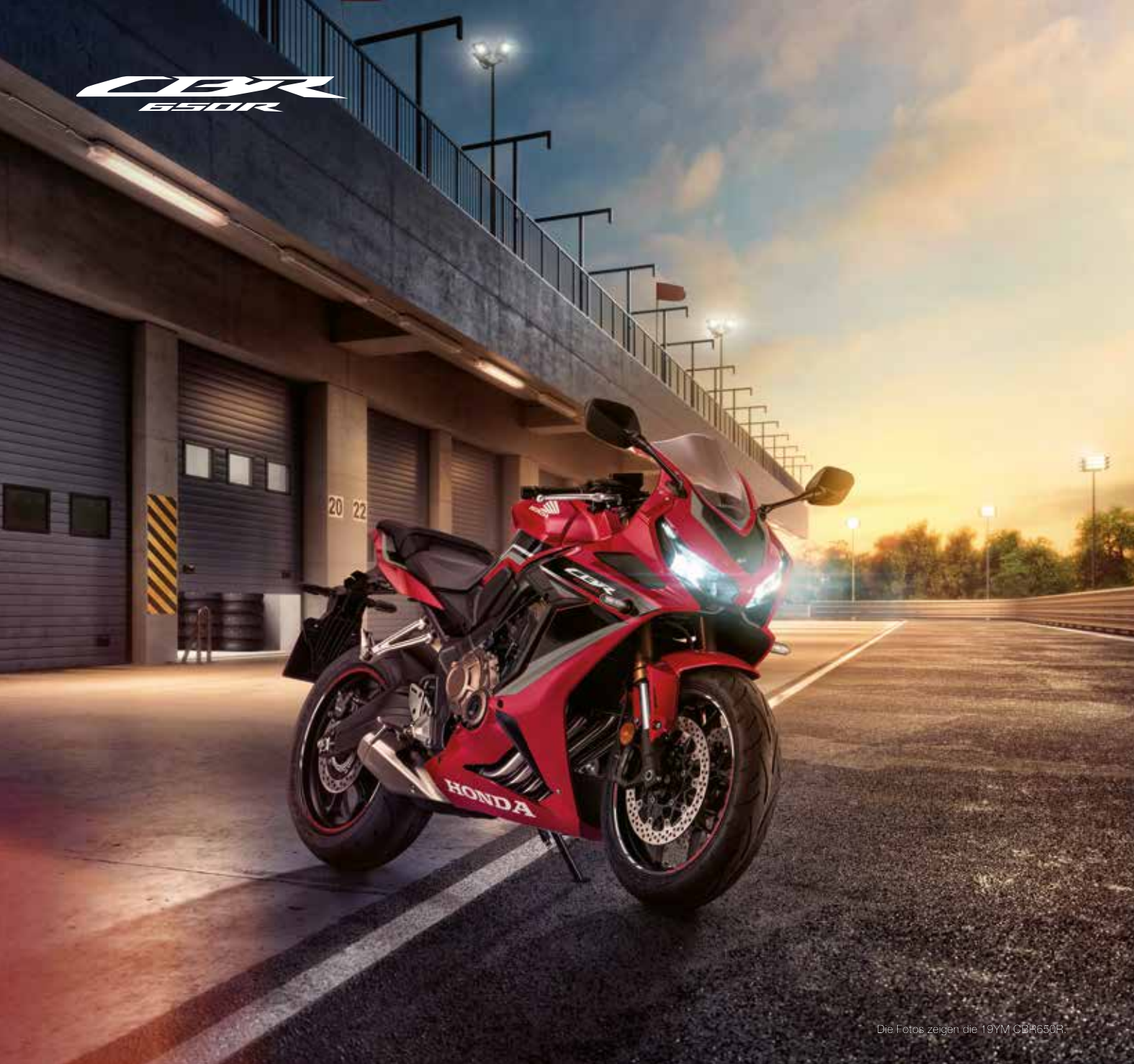
Die Fotos zeigen die 19YM CBR650R.