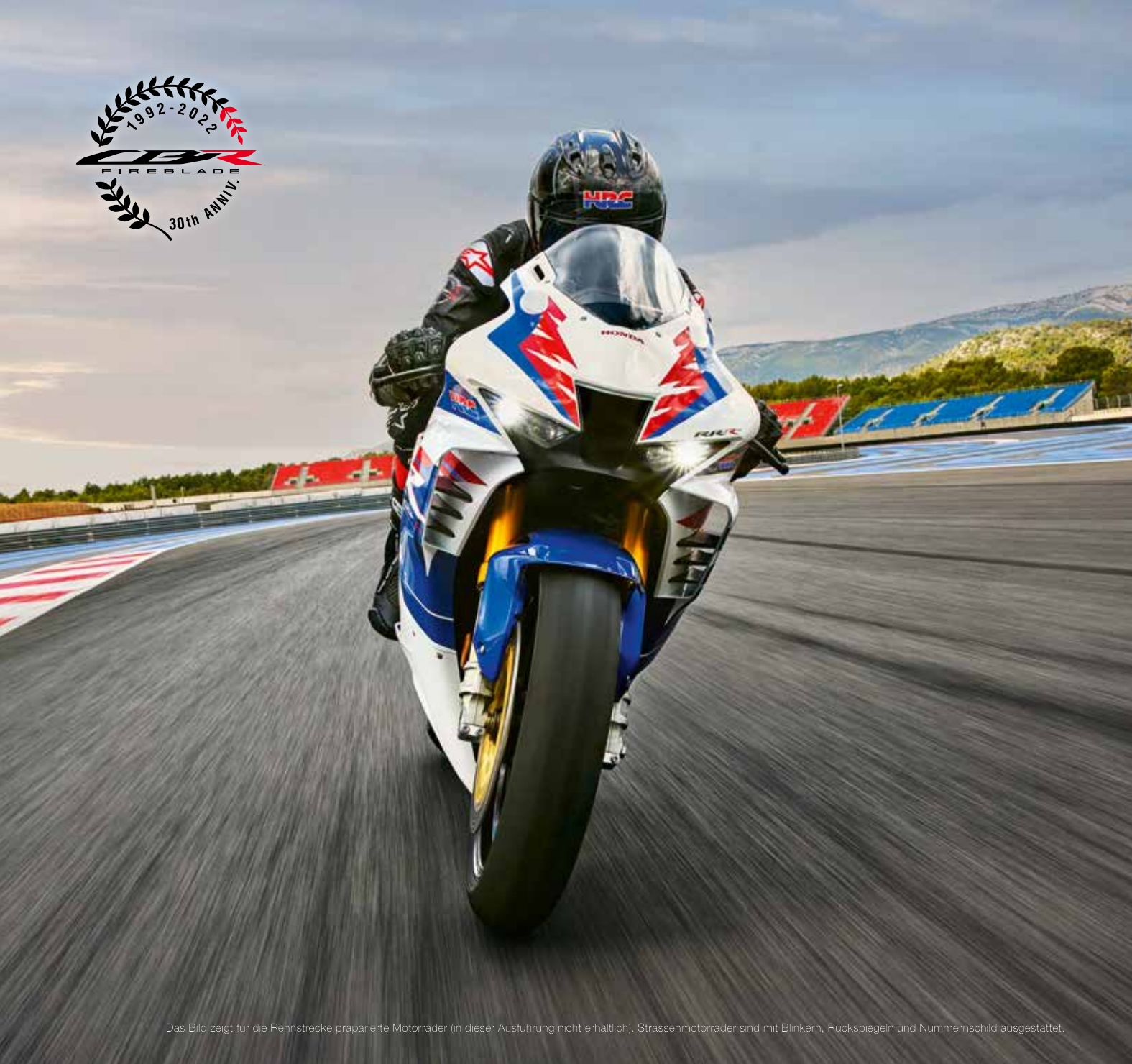
Das Bild zeigt für die Rennstrecke präparierte Motorräder (in dieser Ausführung nicht erhältlich). Strassenmotorräder sind mit Blinkern, Rückspiegeln und Nummernschild ausgestattet.