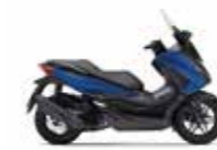
New 2023 Pearl Mat Pearl Pacific Blue