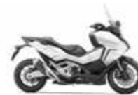
New 2023 Colour Pearl Glare White