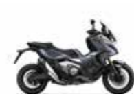
Mat Iridium Grey Metallic