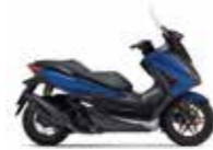
New 2023 Mat Pearl Pacific Blue