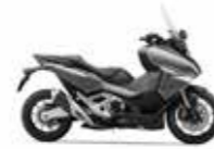
New 2023 Colour Iridium Gray Metallic