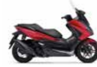
New 2023 Pearl Siena Red