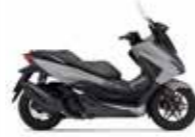
New 2023 Pearl Falcon Gray