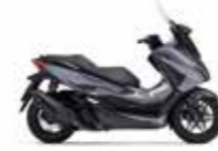
New 2023 Mat Robust Gray Metallic