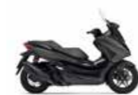
New 2023 Mat Cynos Gray Metallic