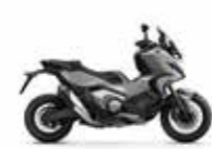
Pearl Deep Mud Grey