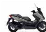
New 2023 Pearl Falcon Gray