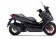
New 2023 Special Edition Mat Cynos Gray Metallic