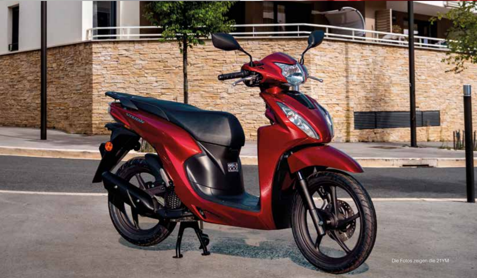
Die Fotos zeigen die 21YM