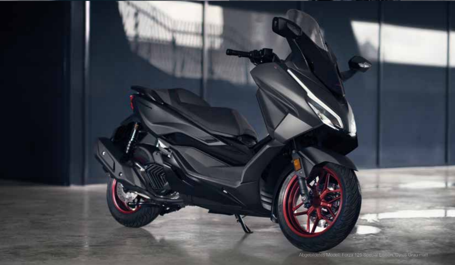
Abgebildetes Modell: Forza 125 Special Edition, Cynos Grau matt