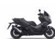
Mat Carbonium Grey Metallic