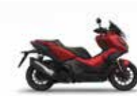
Mat Carnelian Red Metallic