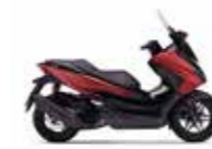
New 2023 Mat Carnelian Red Metallic