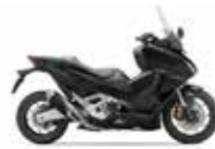
New 2023 Colour Mat Ballistic Black Metallic