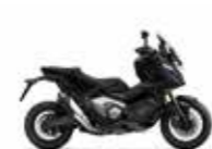
Mat Ballistic Black Metallic