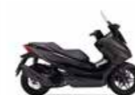
New 2023 Mat Cynos Gray Metallic