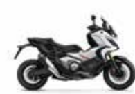
New 2023 Colour Shasta White