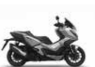
Spange Silver Metallic