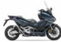
New 2023 Colour Mat Jeans Blue Metallic